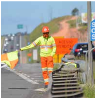
Interdições com muitos transtornos

Novo trecho das pistas marginais da rodovia D. Pedro I (SP-065), do km 129 ao km 134, foi liberado para o tráfego no dia 16/12. Este trecho, entre o trevo da Leroy Merlin e entroncamento com a rodovia Gov. Adhemar de Barros (SP-340), se conecta a outro que segue até o km 140, no trevo de Barão Geraldo. O viaduto construído no Trevo do Carrefour, no km 133, que será utilizado pelos moradores do bairro Parque Imperador para seguir em direção à Anhanguera, também foi aberto.