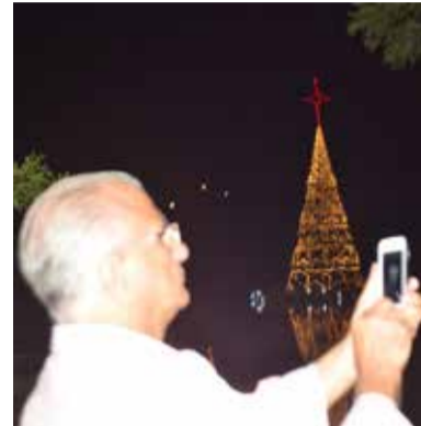
Frequenterador se fotografa na Lagoa iluminada

O coral na proa da caravela, as luzes no entorno da lagoa, os efeitos visuais e sonoros mais a árvore iluminada dentro da lagoa chegou a arrancar alguns aplausos e garantiu alguns selfies.