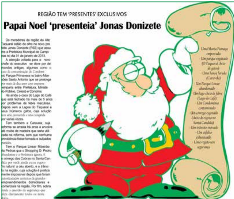
Reprodução da matéria publicada na edição 0056 de 15 de abril de 2012. Antes da posse

Sendo assim, foi no entorno da caravela reformada que o prefeito e sua comitiva abriu as comemorações de Natal deste ano na noite do dia 9 de dezembro. O evento, no entanto, não atraiu grande público como tal-