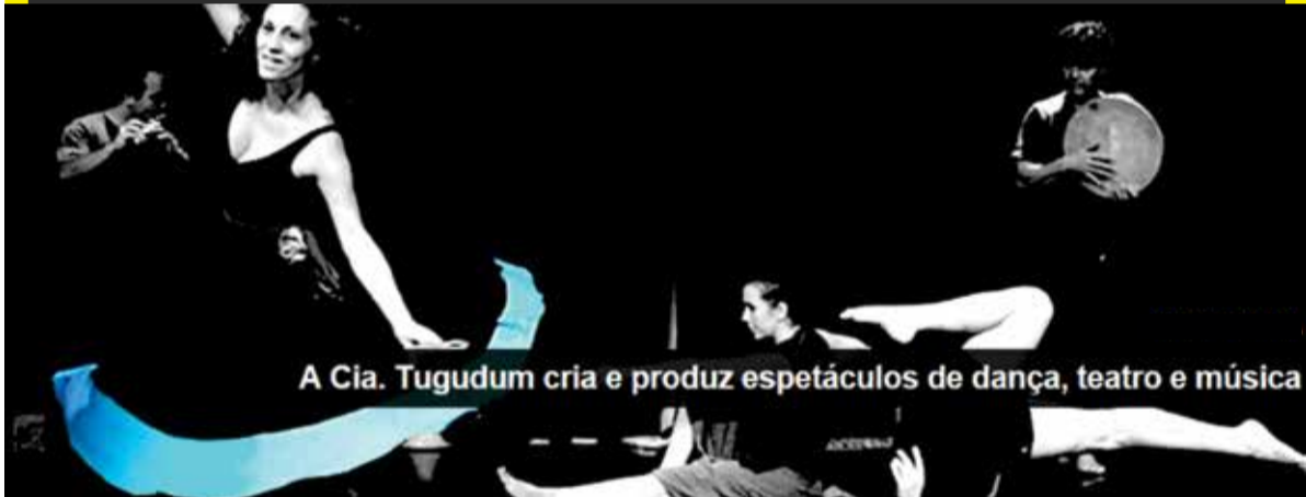
A Cia. Tugudum cria e produz espetáculos de dança, teatro e música