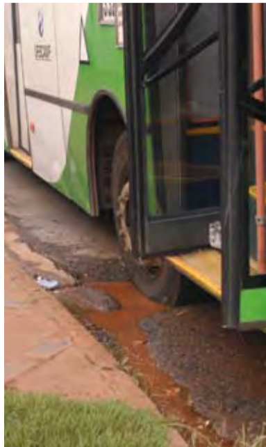
Roda no buraco

O buraco, já passou por vários reparos, mas todos foram feitos sem o devido cuidado e mesmo sem chuva, ele ressurge em pouco tempo.