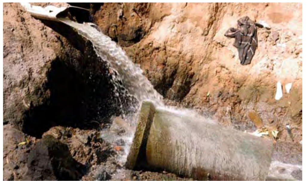
Esgoto em cascata a céu aberto, na Hermantino Coelho, traz mal cheiro e risco à saúde