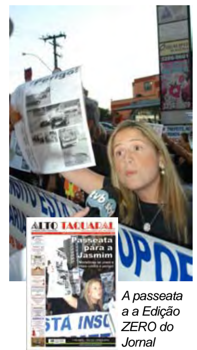
A passeata a a Edição ZERO do Jornal