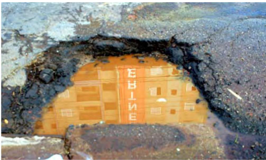
Há um ano, Buraco na Adelino Martins «convida» ao perigo motoristas e pedestres

Em plena rua Adelino Martins, por onde transitam coletivos para Pucc e Unicamp buracos aniversariam com o jornal e atormentam motoristas e pedestres - PÁG. 3 Na rua Hermantino Coelho, chuvas abrem cratera onde o esgoto, em cascata, inferniza a vida dos moradores com o mal cheiro insuportável. Ponte deve resolver o problema - PÁG. 4