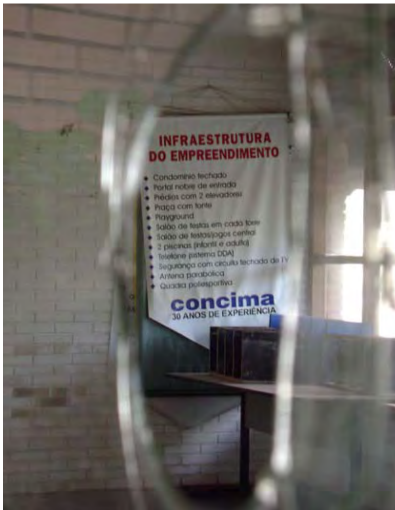
Escritório da Consima, abandonado no Condomínio Primavera

A Consima Incorporadora Construtora Ltda. (anteriormente Concima S/A Construções Cíveis), entregou no dia 30 de março um relatório com levantamentos preliminares que embasam o Plano de Remediação para as áreas contaminadas do bairro Mansões de Santo Antônio. A Cetesb avalia tecnicamente as conclusões do relatório e dará um parecer até meados de maio. Se for confirmada a inexistência de um bolsão de produtos em fase livre alimentando a contaminação, como indicam as análises preliminares, a Prefeitura irá rever o decreto que impede obras na região e poderá finalmente liberar os habite-ses dos moradores do Condomínio Parque Primavera.