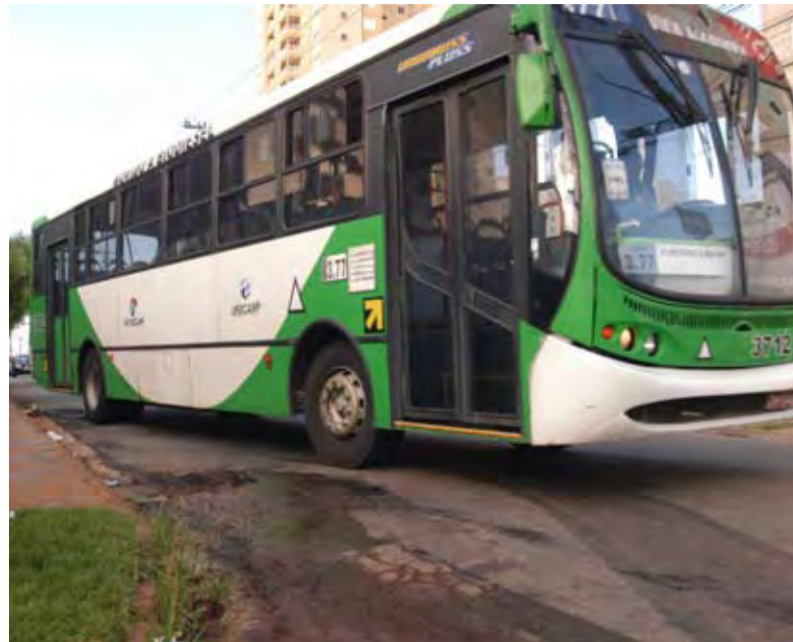
Quando o motorista decide desviar, o veículo impede o trânsito