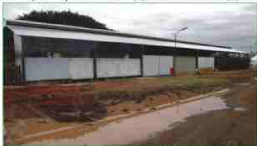
Terreno da Unicamp vai exigir muito esforço para ser transformado

Quanto: R$ 22, estudantes e idosos pagam R$ 16. Até 12 anos não pagam.