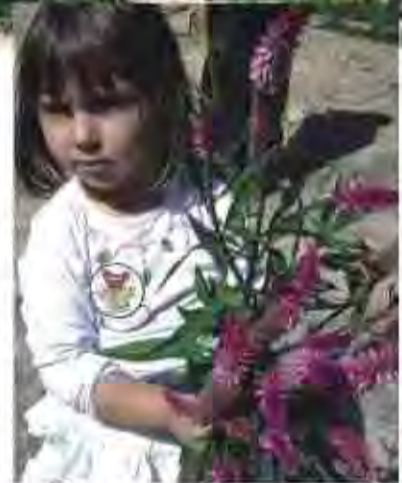
Criança curte flores da praça

"A arrecadação é pequena, mas o importante é fortalecer o espírito coletivo e cuidar da natureza", afirmam os coordenadores do movimento. A próxima ação será reivindicar a iluminação da área.