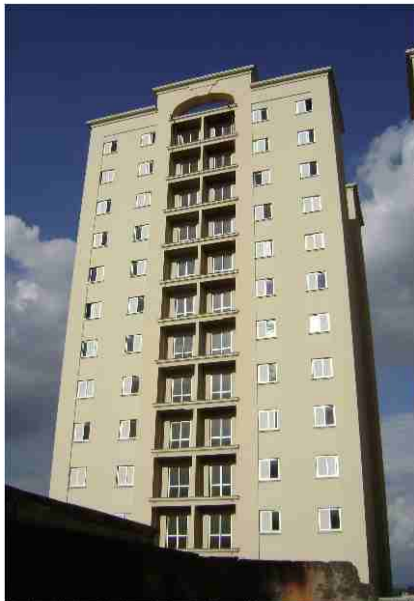
Um dos prédios interditados no Condomínio Parque Primavera, na rua Hermantino Coelho

Questionada então se o promotor não sabia se o Termo já estava lá, ela retrucou: "Isto é o senhor que está dizendo. Ele só me mandou dizer que não tem novidades para informar".