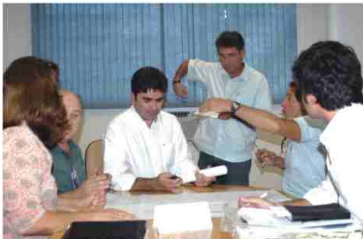
Moradores se esforçaram muito para explicar as reivindicações para os técnicos da Emdec

A EMDEC fará as sinalizações necessárias para que os motoristas possam a utilizá-la com segurança, como alternativa às ruas João Vedovello, Adelino Martins e Jasmim, já congestionadas.